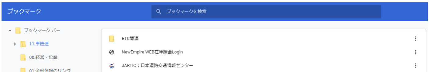
図 ブックマークマネージャーの画面が表示されます。(個別の設定ですので、皆様それぞれ表示が異なります)

表示の中から「NewEmpire WEB 在庫照会 Login」を選択し、右端の 3 つの点表示をクリックします。